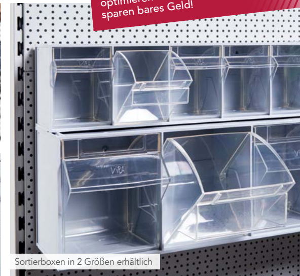
Sortierboxen in 2 Größen erhältlich