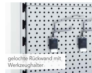
gelochte Rückwand mit Werkzeughalter