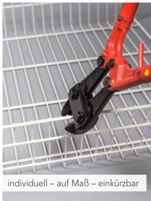
individuell – auf Maß – einkürzbar