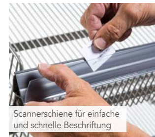
Scannerschiene für einfache und schnelle Beschriftung