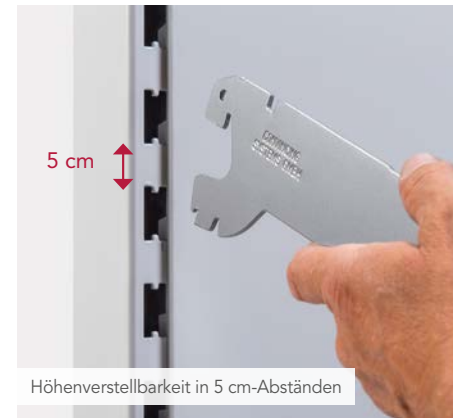
Höhenverstellbarkeit in 5 cm-Abständen