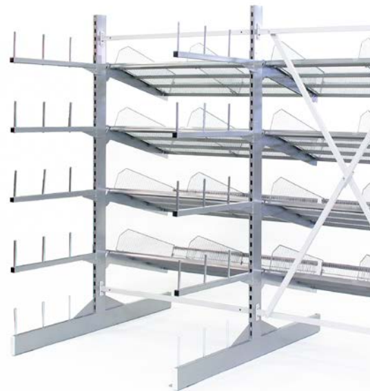
Kragarmregal mit zusätzlichen Regalböden