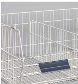
Scanning-Schienen auf Wunsch