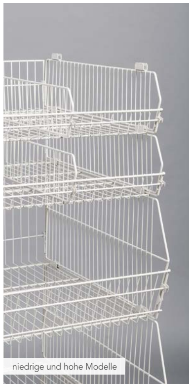
niedrige und hohe Modelle